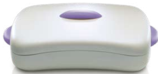
Art. 2245 - 44.5x24.5x13.5 cm./2.5L

DISPONIBILI IN DIVERSI COLORI - AVAILABLE IN MANY COLOURS